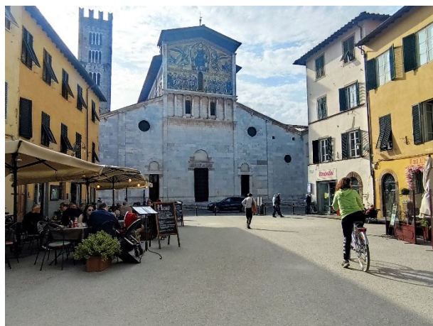
Da via Fillungo verso la Basilica